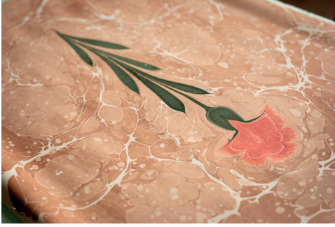
Art de la marbrure Ebru.